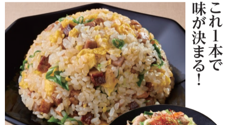
これ一本で味が決まる!

ガーリックとごま油の香ばしい風味、ブラックペッパーがマッチしたソテー用調味料。お肉がやわらかく仕上がります。