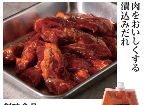
肉をおいしくする 漬込みだれ

創味食品 漬け込みやわらか焼肉オイルソース 参考価格 1,450円 / 700g×12袋 52-0261 常温